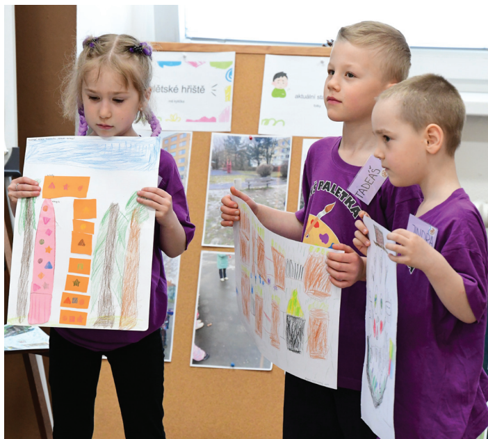
Děti na závěr projektu prezentovaly své dvouměsíční poznatky a nápady při setkání ve středisku SEVER.