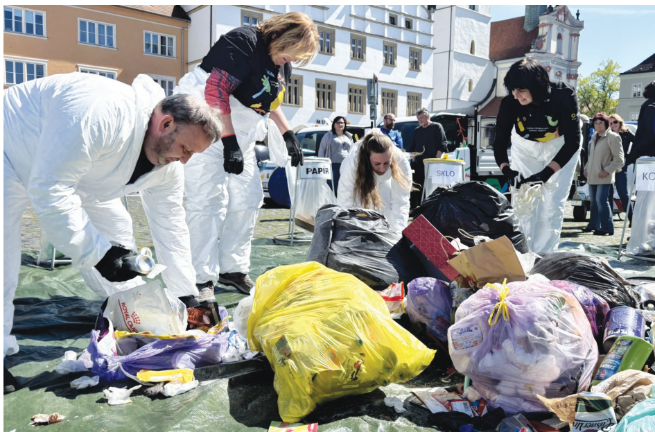
Pracovníci Technických služeb města třídí kontejner na směsný odpad přivezený na Mírové náměstí z ulice Revoluční.

Zároveň jsme si vědomi přetíženosti podzemních kontejnerů, kde v současné době