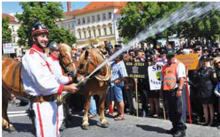
Hasičské slavnosti navštívily v minulosti vždy tisíce lidí.

slavnostnímu nástupu. Na Mírovém náměstí defiluje přes 300 sborů a k vidění jsou také historické prapory, kterých se pravidelně schází přes 120. Důležitým prvkem pro zdárný průběh oslav, a speciálně sobotního slavnostního nástupu, jsou koňská spřežení.