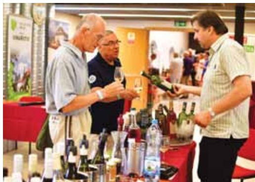
Litoměřický hrozen čeká 10. ročník. Znovu ho navštíví vinaři z celého Česka.

Hrad je v sobotu 4. června otevřen všem mi-