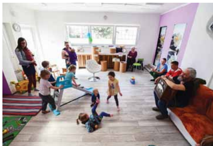
Takto vypadají prostory nového klubu KRA.

Město podpořilo vznik klubu KRA částkou 90 tisíc korun z celkových přibližně 150 tisíc korun. „Projekt nás ihned zaujal, uvítali jsme jej. Vnímáme, že taková místa v našem městě chybí a chceme podporovat jejich