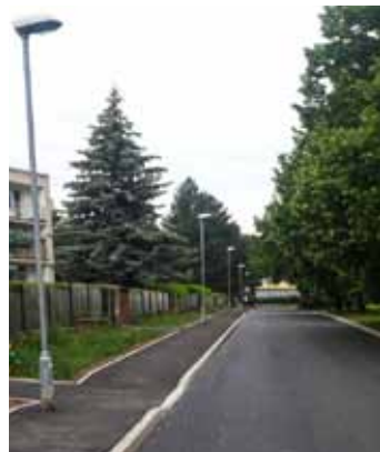
Mládežnická ulice po rekonstrukci.

O více než měsíc se podařilo urychlit rekonstrukci mládežnické ulice. Místo na konci června byla pro běžný provoz otevřena 25. května.