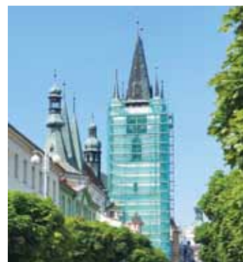
Věž kostela Věšch svatých zahájilo na několik měsíců lešení.

Na brány města klepe léto. A s ním i prázdniny, spousta zážitků a také mnoho kulturních akcí, o nichž se dočtete ve zpravodaji. Užijte si je ve zdraví. Ladislav Chlupáč