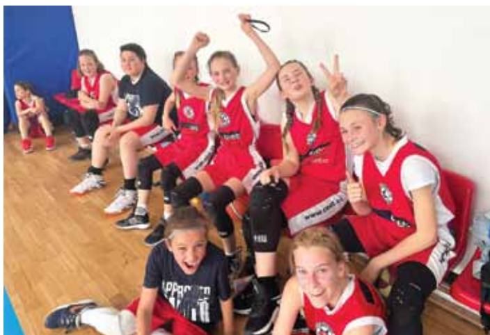
Litoměřické basketbalistky ve věkové kategorii U12 obsadily na národním finále v Pardubicích pěkně 7. místo.

Pro přetrvávajícím zklamáním z uniklého postupu do semifinále v následujícím zápase se Žabinami Brno holky nepodaly