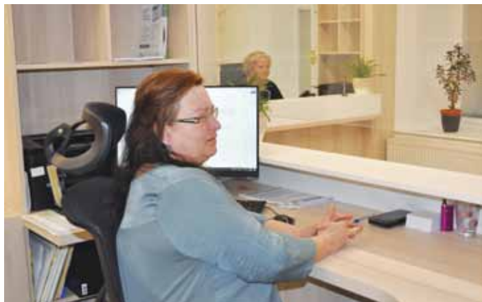
Pracovnice pokladny městského úřadu nyní vítají návštěvníky v novém prostředí na Mírovém náměstí.

Během několika týdnů dojde ke zrušení polední přestávky, a lidé tak budou moci využít služeb pokladny v delším časovém úseku. Na pokladně je možné nově hradit veškeré platby a poplatky pro město Litoměřice, tedy i za svoz komunálního odpadu, psy, poplatky ze správních řízení, ale i udělené pokuty. Tyto záležitosti se dříve hradily v kanceláři poplatků, která sídlí hned za novým pracovištěm pokladny. Samozřejmě je možná platba kartou.