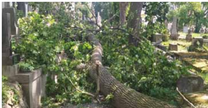
Obrovský nápor větru porazil i silné stromy.

„Město jako pronajímatel hrobových míst je proti odpovědnosti za zdravotní či majetkovou újmu samozřejmě pojištěno, nicméně toto byl zásah „vyšší moci“, který jsme nemohli ovlivnit. Odškodnění