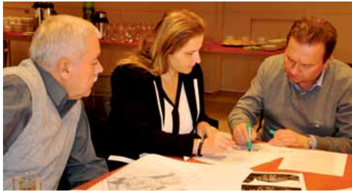
V hradu u pracovních stolů lidé sepisovali své nápady a náměty na budoucí využití tržnice.