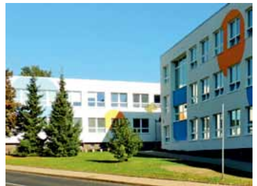
Na prvním snímku vidíme, jak budova, respektive její vstupní část, vypadala v sedmdesátých letech. Druhý přibližuje stav současný.