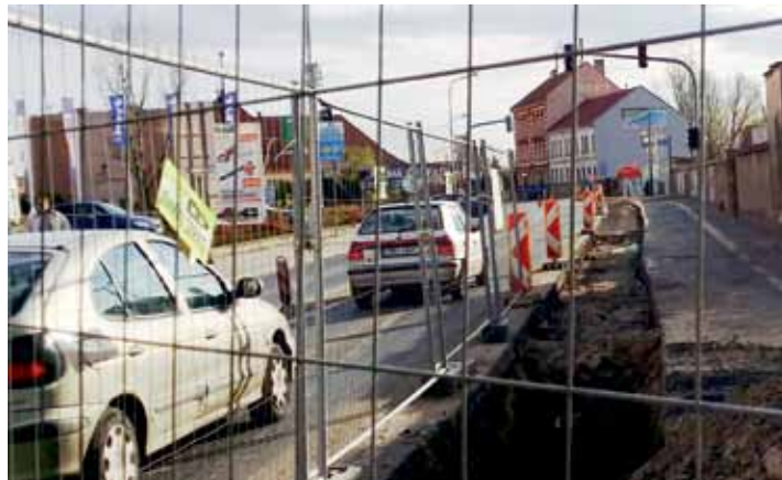
Doprava je sice kvůli právě probíhající stavbě kanalizace v Želeticích omezená, nicméně silnice zůstává průjezdná.