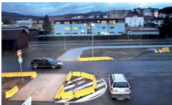
Nová dvě přechodová místa vznikla v Teplické ulici. Žluté zábrany slouží v souladu s předpisy jako ochrana chodců.

Nová přechodová místa, tentokrát na náklady SŽDC, vyrostla i v Teplické ulici. „Logické by se na první pohled zdálo vybudování přechodu ústího do Resslovy