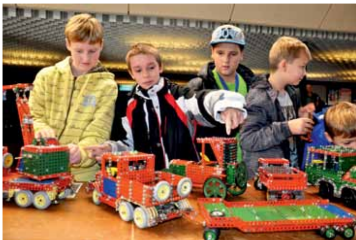
Zatímco práce školních týmů probíhala v hlavním sále, ve foyer domu kultury se uskutečnila Merkurmání. Nejen děti, ale i dospělí z řad veřejnosti obdivovali výstavu Merkuru zpestřenou řadou modelů.

Školáci soutěžili hned v několika kategoriích, přičemž jednou z nich byla i prezentace vlastních projektů. Například družstvo Základní školy Havlíčkova se zabývalo ražbou tunelů, přičemž se zaměřilo na bývalý železniční tunel v Litoměřicích. Zkusilo si postavit i vlastní minitunel ze směsi písku a hlíny, tedy nesoudržného materiálu. Svě zkušenosti pak prezentovalo před odbornou porotou. Školáci z Chemnitz se zase zabývali nedokonalostmi v osvětlení měst. V projektu poukázali i na jedno z nevyhovujících svítidel umístěné