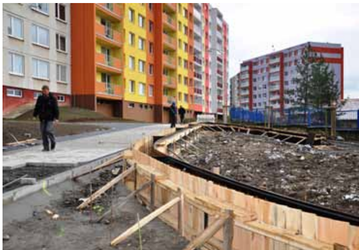
Na řadě míst byly na konci listopadu v rámci 1. etapy regenerace sídliště dokončovány chodníky. Na pravé straně vidíme základy budoucího místa určeného k oddychu se třemi herními prvky pro děti.

Revitalizace pokratického sídliště má celkem pět etap. Právě finišující první etapa se týká především okolí Pokratického potoka s návaznými veřejnými prostory a pěší trasy za objekty ulice A. Muchy. Zásadní opravou prochází lávka u teplovodu. Budováno je nové odpočinkové místo s herními prvky. Součástí je i instalace nového mobiliáře, úpravy stávajících komunikací a výsadba zeleně. (eva)