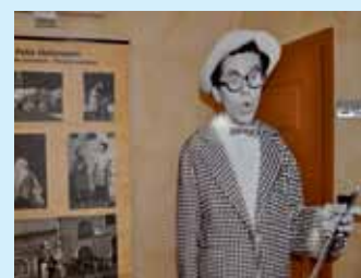
Vzhledem k zájmu veřejnosti se pořadatelé rozhodli ponechat výstavu otevřenou po celý rok.