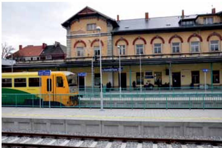
Horní vlakové nádraží je díky bezbariérovým nástupním ostrůvkům i přechodu přes trať bezpečné.