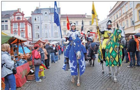
Král s družinou projde městem ve 14 hodin.

Interpreti, kteří zaručí příjemnou pohodu a atmosféru, dostanou přednost před zvukovými jmény a množstvím decibelů. Vedení Městských kulturních zařízení Litoměřice se tak při organizaci letošního vinobraní bude držet osvědčeného modelu. Podle něj proběhne i letos v centru města v komornější atmosféře. Sřtelecký ostrov pak bude patřit o poznání rušnějšímu Ostrovnímu festivalu, pořádanému soukromou agenturou.