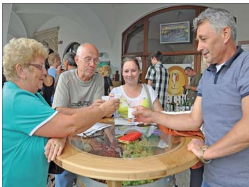
Kolemjdoucí v podlouбі před radnicí koštovali nejlepší produkty vinařů.

Patřilo mezi ně i červené víno Fratava ročník 2009 z Roudnického lobkowiczského vinařství nebo bílý Ryzlink rýnský 2009 z Žernoseckého vinařství, které se v odborném hodnocení degustátorů umístilo nejvýše. Paradoxně právě obec Velké Žernoseky musela zrušit letošní vinobraní. Nezvykle silné květnové mrazíky totiž spálily vinice. „Přeji proto všem vinařům, aby se letošní rok již nikdy neopakoval,“ uvedl starosta Ladislav Chlupáč při předávání cen. (eva)