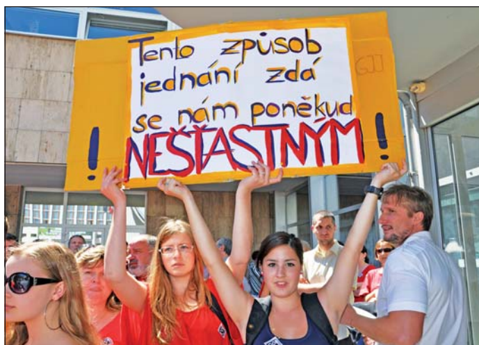
Své názory vyjádřili studenti i prostřednictvím transparentů.

Emočně vypjatou atmosféru umocnily projevy pedagogů, kterým již byly dány výpovědi, nebo