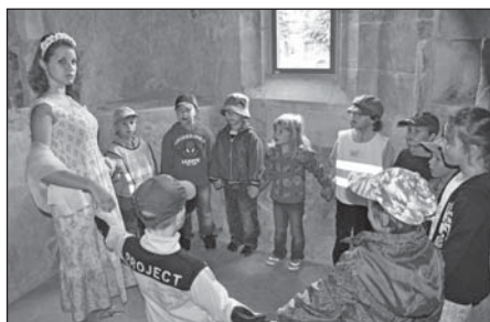
V gotické kapli na děti čekala víla.

„Prohlídky koncipované formou pohádkového putování se dětem zásluhou studentek pedagogické školy velmi líbily. Pokračovat v nich proto budeme i v příštích měsících,“ zhodnotila první den jejich konání marketin-