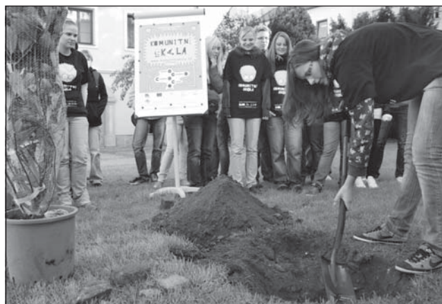
Studenti vysadili strom na počest sira Nicolase Wintona.

Studenti 1. Kladenské školy podnikatelské administrativy v Litoměřicích vysadili před divadlem K. H. Máchy strom. Učinili tak na počest sira Nicolase Wintona, který v průběhu druhé světové války zachránil 669 židovských dětí.