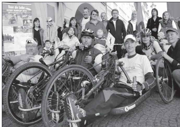
Zdravotně handicapovaní sportovci vyprovodili na trať i obyvatelé Litoměřic.

Rozdíl mezi handicapovanými a zdravými sportovci by v jejich nasazení nikdo nepoznal. Zajímavá byla ale speciálně