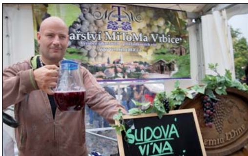
Přestože burčák letos všeobecně díky nepřízní počasí nedosahuje takové kvality, opět tekl proudem.

Tak uplakané vinobraní Litoměřice snad ještě nezažily. Kdo přišel na ochutávku burčáku již v pátek, vychutnal si na Mírovém náměstí při krásném podzimním počasí atmosféru středověkého tržiště, včetně takových dobových „lahůdek“, jako je například upálení čarodějnice. Sobotní program se však doslova topil v přívalech deště. Přítom příjezd krále se zhruba 120 člennou družinou byl vzhledem k množství historických postav