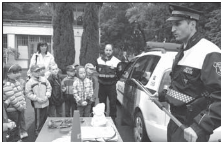
Strážníci městské policie dětem kromě jiného ukázali i pomůcky používané při odchytu zatoulaných zvířat.

Jak správně přecházet silnici při cestě do školy a z ní se na začátku září učily na dopravním hřišti zhruba tři stovky žáků prvních tříd litoměřických základních škol. Bezpečnostní akci pro ně organizovaly Dům dětí a mládeže Rozmarýn, Zdravé město Litoměřice, městská policie a Policie ČR. Pomohly i studentky střední pedagogické školy, které dětem vysvětlovaly, co mají dělat, naleznou-li třeba injekční stříkačku, krabičku s léky, případně další rizikové předměty.