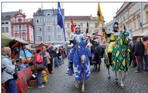
Příjezd královny družiny čítající zhruba 120 lidí byl velkolepou podívanou.