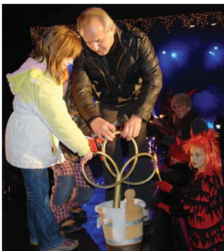
Rozsvítit vánoční strom otočením velkého zlatého klíče pomohli starostovi náhodně vybraná dívka a chlapec.

Banda pekelníků chtěla Litoměřičanům ukrást v pátek 4. prosince Vánoce. Malí i velcí čertí v čele s Luciferem chrlili oheň na rudě svítícím pódiu směrem k lidem, jež zcela zaplnili střed náměstí. Tak jak to ale ve správné pohádce bývá, i tentokrát zvítězilo dobro nad zlem. Z více než čtyřicetimetrové výšky věže kostela slétl anděl, který starostovi města přinesl obří zlatý klíč, jehož pootočením se i letos rozsvítil vánoční strom, stejně jako ostatní výzdoba centra města. Úspěšnou snahu o záchranu Vánoc korunoval za hudebního doprovodu písně Celine Dion ohňostroj.