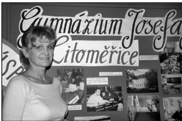
V devadesátileté historii litoměřického gymnázia první stojí v jeho čele žena.

Nejprve se zaměřila na stav budovy. Zahájila její renovaci, malování tříd, výměnu osvětlení, odstranění umakartového obložení, pro studenty zřídila dosud chybějící školní bufet. Netají se tím, že od svého zřizovatele se pokusí získat finance na náročnější modernizaci interiérů i exteriérů. Prostrádá studentům volně přístupnou knihovnu. „Sice tu je, ale sídlí v ní kabinet. Je třeba ji udělat volně přístupnou, nejlépe se dvěma počítači s internetovým připojením,“ říká stručně. Žákům hodlá zpříjemnit čas o volných hodinách, a to prostřednictvím tzv. školního bunkru, tedy místnosti,