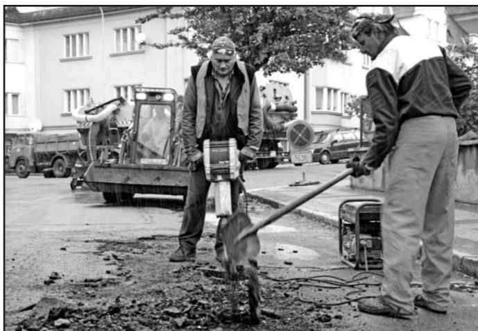
Výtluky byly na podzim opravovány i v Palachově ulici.