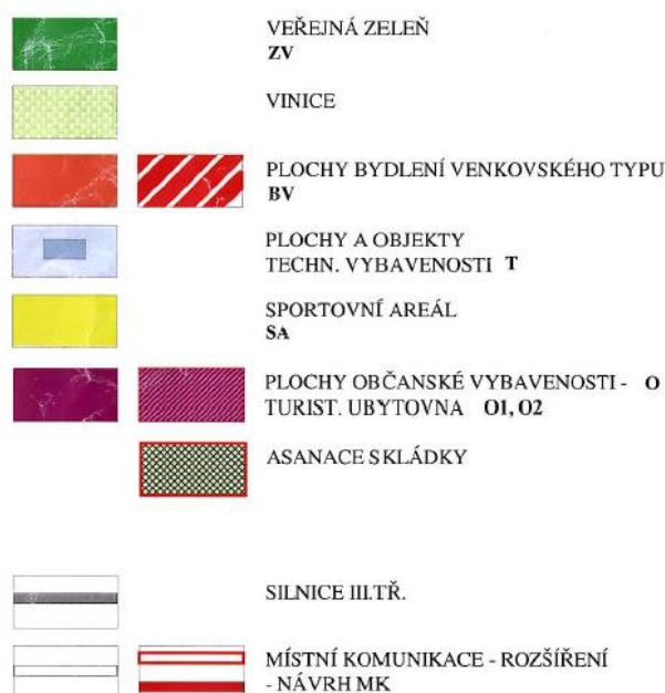
Legenda k hlavnímu výkresu ÚPO Michalovice

Dne 20. 1. 2021 nabyl účinnosti nový Územní plán (dále jen „ÚP“), který byl zpracován urbanistickým ateliérem Architekti Černí – Mgr. Ing. arch. Zdeněk Černý. Byla tak zpracována nová urbanistická koncepce území, která stanovuje základní koncepci rozvoje území obce, reflektuje dosavadní vývoj obce, navazuje na předchozí územně plánovací dokumentaci a v ní stanovené rozvojové tendence na území obce a zohledňuje další požadavky obce specifikované v zadání územního plánu. Urbanistická koncepce stabilizuje stávající plochy bydlení, občanské vybavenosti a technické infrastruktury, stabilizuje a doplňuje plochy veřejných prostranství a rozvíjí bydlení v návaznosti na zastavěné území.